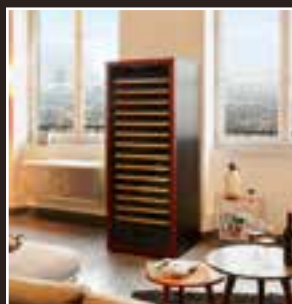
Caves à vins - Gamme Première Wine Cabinets - Première Range