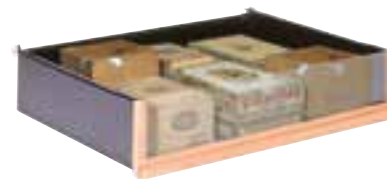
Tiroir de rangement Storage drawer

La Cave à Cigares est étudiée pour être évolutive. Plusieurs types de rangements vous sont proposés pour répondre au mieux à vos besoins.