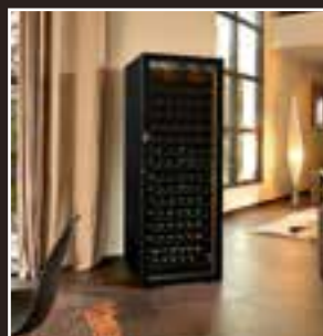
Caves à vins - Gamme Revelation Wine Cabinets - Revelation Range