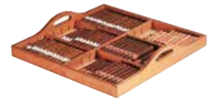
Plateau de présentation sur clayette coulissante (en bois exotique imputrescible). Presentation tray on sliding rack (in rot-proof exotic wood).