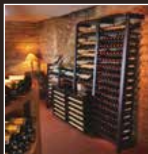
Rangements et Climatiseurs de Cave Storage Systems & Cellar Conditioners